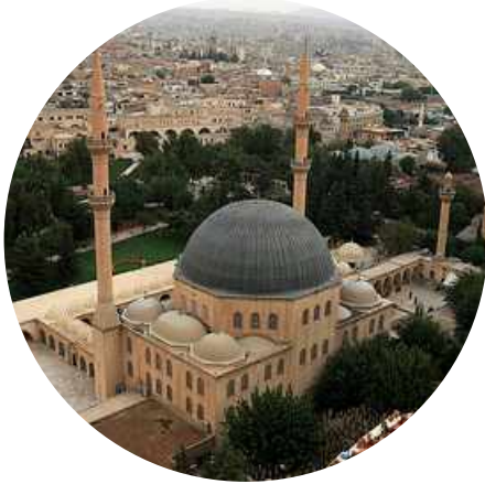
Şanlıurfa Dergah Camii

Örnekler camii halılarından alınmıştır. Cami halıları dezenfeksiyon öncesi ATP yoğunluğu 238 iken uygulamadan 9 dakika sonra 12'ye düşürülmüştür.